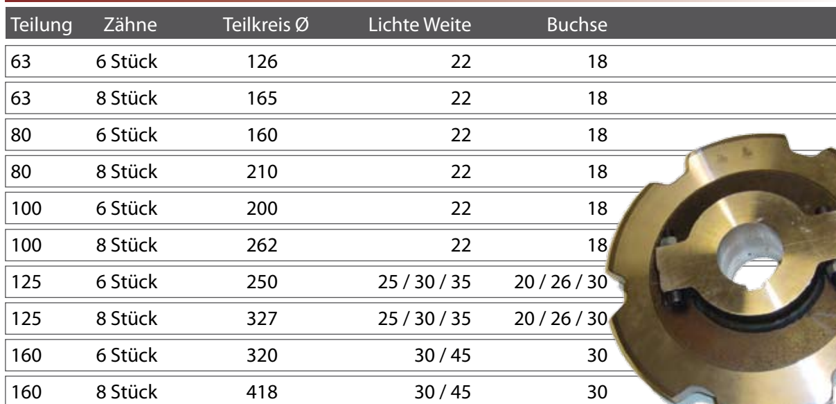
Kettenräder Trogförderketten (Abmessungen in mm)

Das Kettenrad der Trogförderkette ist sowohl in einteiliger wie auch in zweiteiliger Ausführung kurzfristig lieferbar: