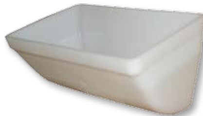
CC-S-Elevatorbecher (Abmessungen in mm)

Beim Typ CC-S handelt es sich um einen Elevatorbecher mit hoher Kapazität. Aufgrund der extra starken Wanddicke besitzt dieser Becher eine lange Lebensdauer und ist in HDPE- und Nylonausführung erhältlich.